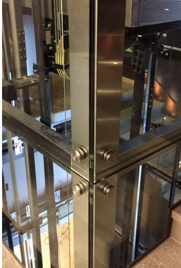
STRUTTURA BRC PER INTERNO in edificio commerciale. Fissaggio vetri puntuale con borchie corte. Vetri trasparenti