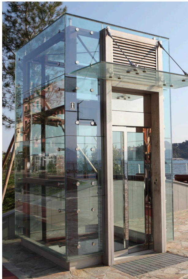
STRUTTURA BRC PER ESTERNO in area urbana. Fissaggio vetri e tetto puntuale con borchie lunghe. Vetri trasparenti